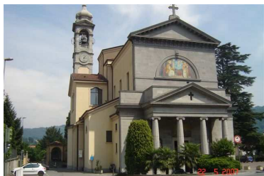
Chiesa Prepositurale di Brivio