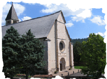
Basilica dei Santi Martiri Sanzeno (TN)